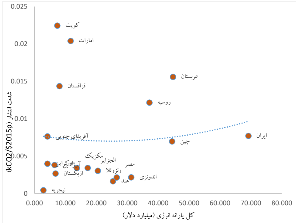
شکل (۲). شدت انرژی برحسب کل یارانه انرژی