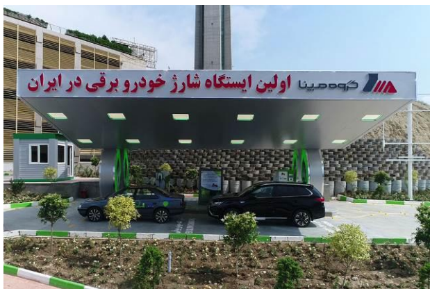
شکل (۱): ایستگاه های شارژ خودروی برقی گروه مپنا

هر چند در طی چند سال گذشته، بحث‌هایی درباره تولید خودروهای الکتریکی در ایران در محافل علمی و صنعتی، درگرفته است اما به نظر می‌رسد صنایع خودروسازی ایران، همچنان توجه چندانی به ساخت خودروهای الکتریکی ندارند. هم‌اکنون خودروسازان داخلی با به کارگیری پلتفرم‌های کنونی اقدام به ساخت چند نمونه خودروی الکتریکی کرده‌اند. شرکت جتکو مطابق با نقشه راه محصولات ایران خودرو، طراحی خودروی تمام برقی را نیز در دستور کار خود قرار داده است و در نظر دارد از طریق مهندسی معکوس و کسب دانش لازم، به دنبال باز طراحی و نمونه‌سازی خودروی تمام برقی و تولید در کشور باشد. محصول جدید بنزینی ایران خودرو که استعداد مناسبی در پلتفرم آن برای برقی سازی پیش بینی شده، به عنوان خودروی الکتریکی این شرکت در نظر گرفته شده است و نمونه اولیه آن تا کم‌تر از ۱۸ ماه ارائه و تولید انبوه نیز یک سال بعد از نمونه سازی می‌تواند آغاز شود (خبرگزاری مهر، ۱۳۹۸) مدیرعامل گروه مپنا از امضای تفاهم‌نامه همکاری این مجموعه با گروه خودروسازی سایپا برای تولید نخستین خودرو برقی ایرانی خبر داد (خبرگزاری تسنیم، ۱۳۹۹).