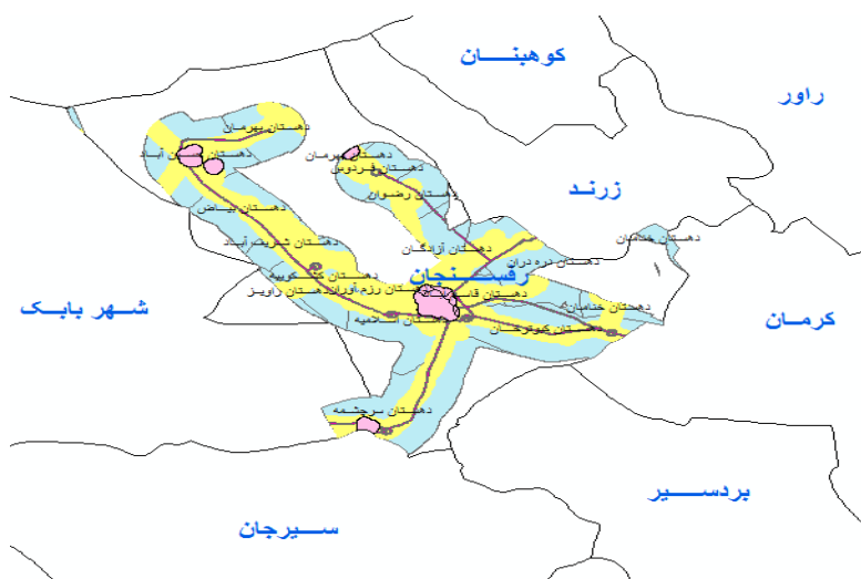
شکل ۲. نتیجه نهایی مکان‌یابی نیروگاه بادی

برای تعیین حریم مناسب شهرها، بزرگراه‌ها و خطوط انتقال توان الکتریکی با توجه به اینکه نقشه GIS مربوط به آنها را در اختیار داریم از ابزار Buffering استفاده می‌کنیم. در نهایت با استفاده از همپوشانی کلیه لایه‌های بدست آمده، مناسب‌ترین مکان جهت احداث نیروگاه بادی در استان کرمان به صورت شکل (۶) بدست آمد.