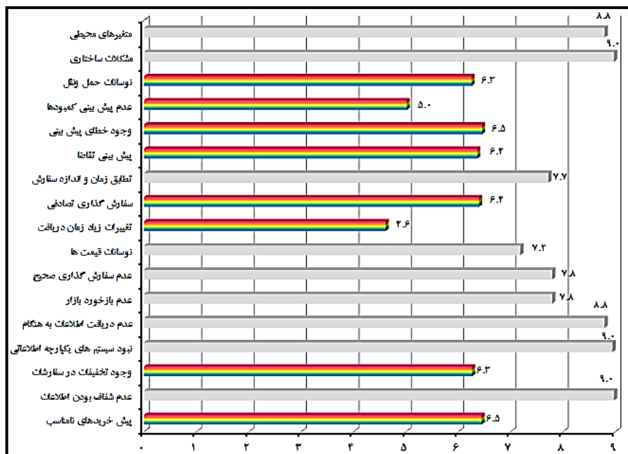
شکل ۳. میانگین امتیازات فازی شاخص‌های تصمیم‌گیری

استفاده از روش دلفی فازی داده‌ها جمع‌آوری شدند. میانگین امتیازات نهایی کسب شده هر شاخص در شکل ۳ ترسیم شده است.