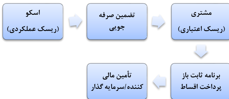
شکل ۲. کلیات روش کار قرارداد تضمین صرفه‌جویی انرژی

در این نوع از قراردادها، قرارداد خدمات انرژی بین کارفرما (مصرف‌کننده انرژی) و شرکت خدمات انرژی منعقد می‌گردد و مطابق آن شرکت خدمات انرژی تحقق مقدار مشخصی صرفه‌جویی انرژی را برای مصرف‌کننده تضمین می‌نماید. هزینه اجرای پروژه توسط کارفرما تأمین می‌گردد که یا خود آن را پرداخت نموده و یا اینکه از طریق دریافت وام از بانک یا بنگاه‌های مالی و اعتباری تأمین می‌گردد. (درس، ۲۰۰۳، ص ۴)