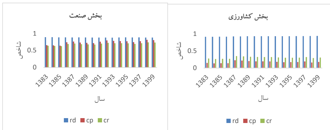
شکل (۲): شاخص معقولیت ساختاری، درجه وابستگی و هماهنگی بخش کشاورزی و بخش صنعت