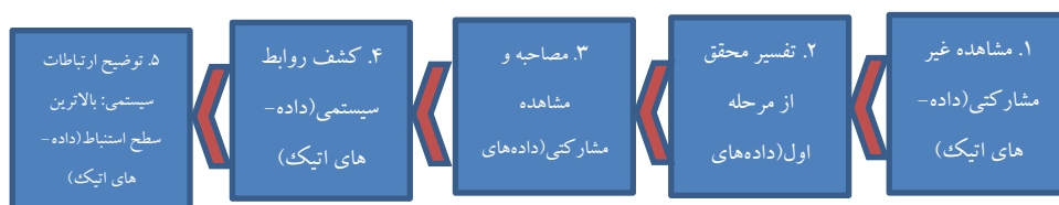
شکل ۲: ۵ مرحله قوم‌نگاری انتقادی کارسپکن (Carspecken, 1996)

این پژوهش با استفاده از روش کیفی و در چارچوب پارادایم تفسیری انجام شده است (Vaderstoep & Johnston, 2009). برای درک عمیق نیروهای اجتماعی، کالبدی و سیاسی شکل‌دهنده سبک زندگی و رفتار شهروندان، از تکنیک قوم‌نگاری انتقادی بهره گرفته شده است. این روش، که فرهنگ را از منظر قدرت تحلیل می‌کند، هدفی فراتر از توصیف صرف دارد و به دنبال ایجاد تغییراتی برای بهبود شرایط زیستی شرکت‌کنندگان است (Creswell, 2013, Lassiter & Ryan, 2007). چارچوب انجام پژوهش به کار برده شده، شامل پنج مرحله (به صورت رفت و برگشتی به منظور دستیابی به استنتاج معتبر) است (شکل ۲). هدف از سه مرحله اول بازسازی مضامین فرهنگی و در دو مرحله پایانی توصیف روابط سیستمی است (Carspecken, 1996).