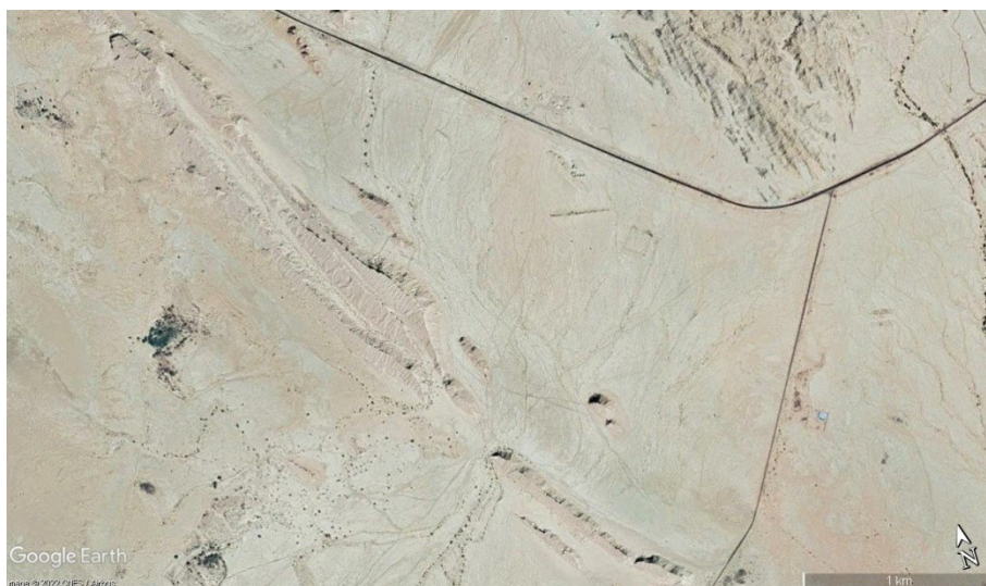
شکل ۱. تصویر موقعیت انتخاب شده برای نصب نیروگاه خورشیدی

شرایط دمائی و تابش منطقه بگونه‌ای است که ۹ ماه از سال امکان ۱۰ ساعت استفاده مفید از انرژی خورشیدی وجود دارد و میانگین تابش منطقه مقدار مناسبی است (شکل ۳). با در نظر گرفتن ساخت نیروگاهی با انرژی ۲۰۰ MW برای تامین انرژی مورد نیاز سایت نفتی منطقه، در شبیه‌سازی با نرم‌افزار PVSOL ۲۰۲۱ از پانل‌های خورشیدی ۴۵۰ وات در دو ردیف با زاویه ۲۴ درجه نسبت به جنوب استفاده شده است. برای جلوگیری از افت ولتاژ و امکان درویابی متوازن، نیروگاه در قطاع‌های ۲MW طراحی و بر اساس آن برای توان مورد نظر توسعه یافته است. با توجه به شرایط اقلیمی منطقه ضریب عملکرد نیروگاه بهره مناسبی داشته و مقدار ۰/۷۵٪ است. همچنین توپولوژی مسطح و به دور از پستی و بلندی‌های طبیعی و عدم وجود سازه بلند در اطراف منجر به مقدار کم ضریب کاهنده سایه‌اندازی به حدود ۰/۸ درصد در هر سال است.